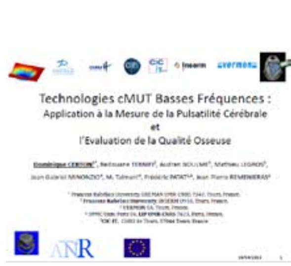
Communication orale de Dominique CERTON (CIC-IT de Tours)