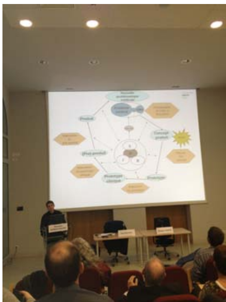
Alexandre Moreau-Gaudry explique le cycle de CREPS à l'assemblée