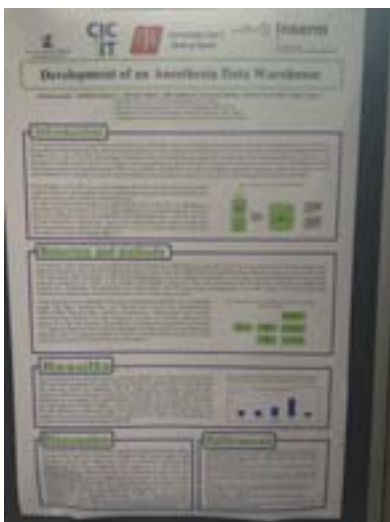
Poster d'Antoine Lamer (CIC-IT de Lille)